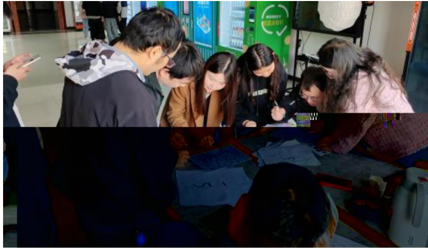
图 卓越团队建设共识营